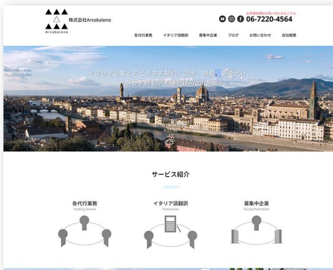
株式会社Arcobaleno WordPress独自テーマ・デザイン・開発