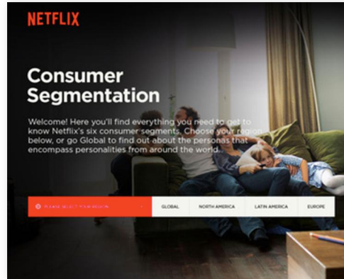
Netflix社内マーケティングサイト Jekyllを用いた独自テーマ・開発